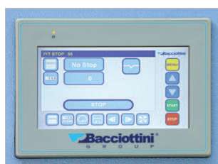
Écran de commande tactile pour effectuer tous les réglages.