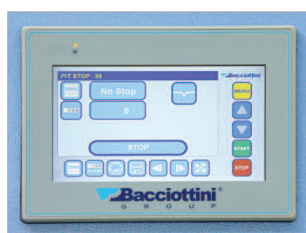
Écran de commande tactile pour effectuer tous les réglages.