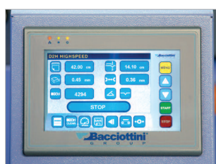
Écran de commande tactile pour effectuer tous les réglages.