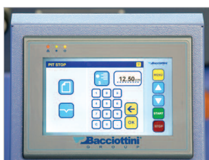
Écran de commande tactile pour effectuer tous les réglages.