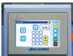
Écran de commande tactile pour effectuer tous les réglages.