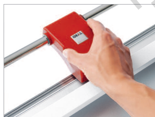
Idéale pour couper toutes sortes d'imprimés grands formats.