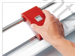
Idéale pour couper toutes sortes d'imprimés grands formats.