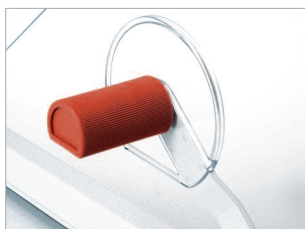
Dispositif de pression manuelle dosable par levier.