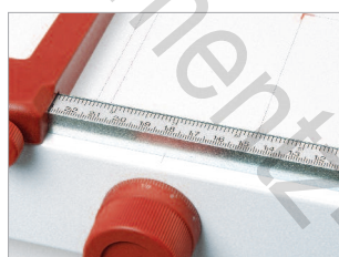
Butée latérale graduée en millimètres et en pouces.