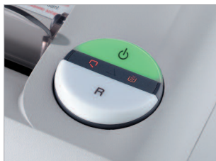
Commande multi-fonctions EASY-SWITCH.

GARANTIE À VIE SUR LES CYLINDRES DE COUPE CF & CC