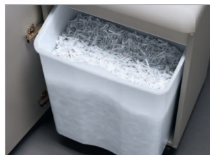
Réceptacle pratique de 75 litres avec poignée de préhension.