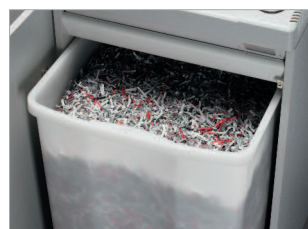
Réceptacle pratique de 100 litres avec poignée de préhension.