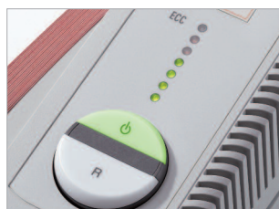
Commande EASY-SWITCH et système anti-bourrage ECC.