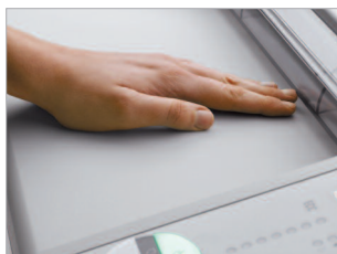
Volet de sécurité contrôlé électroniquement au niveau de l'ouverture.