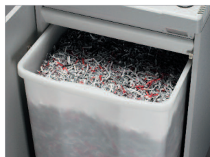
Réceptacle pratique de 165 litres avec poignée de préhension.