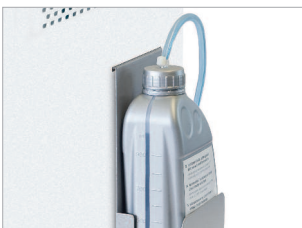
Lubrification automatique des cylindres de coupe.

GARANTIE 5 ANS SUR LES CYLINDRES DE COUPE CF & CC