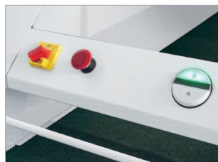
Commande multi-fonctions EASY-SWITCH.