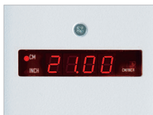
Affichage digital des dimensions en millimètres et en pouces.