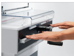
Commande bi-manuelle EASY-CUT.