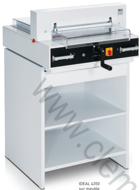
IDEAL 4350 sur meuble

Massicot électrique à pression automatique, adapté au format A3, idéal pour le service reprographie des entreprises et des administrations.