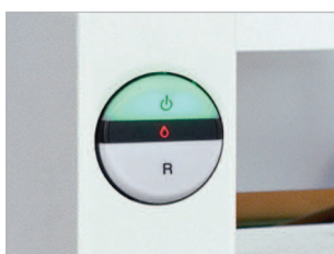
Commande multi-fonctions EASY-SWITCH.