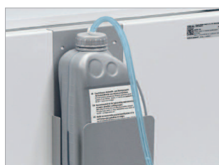
Lubrification automatique des cylindres de coupe.