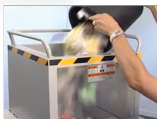
Entonnoir pour vider directement le contenu d'un corbeille à papier.