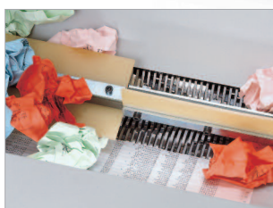
Accepte sans problème les papiers froissés.

GARANTIE 5 ANS SUR LES CYLINDRES DE COUPE CC