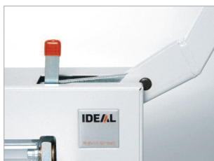
Dispositif de blocage de lame (levier en position haute).