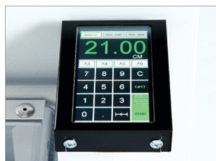
Écran de commande tactile programmable.