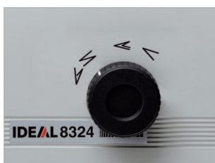
Molette de sélection rapide du type de pli.