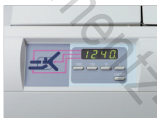
Panneau de commande très simple d'utilisation avec écran LCD.