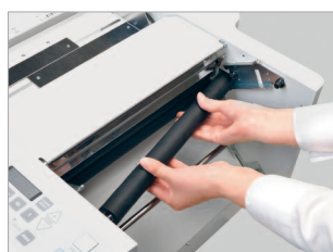
Rouleaux de pliage amovibles pour une maintenance aisée.