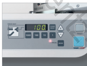
Panneau de commande très simple d'utilisation avec écran LCD.