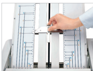
Réglage facile du type de pli grâce à des symboles et codes couleurs.