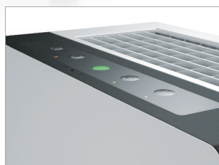
Panneau de commande très simple d'utilisation.