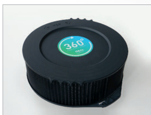
Technologie de filtration de l'air hautes performances 360°.