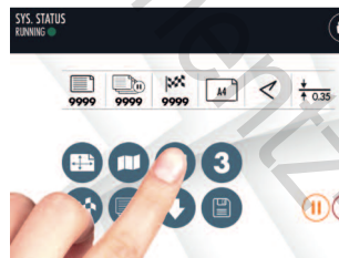
Écran de commande tactile pour effectuer tous les réglages.