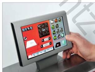
Écran de commande tactile pour effectuer tous les réglages.