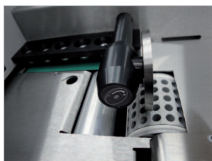
Système d'alimentation à succion par le bas (pas de rupture de flux).