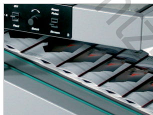
Sortie motorisée en nappe à l'avant de la machine.