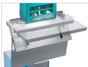
Plateau pivotant pour réaliser de l'agrafage à cheval (brochures).

Brochures Agrafage à cheval sur la longueur de la liasse