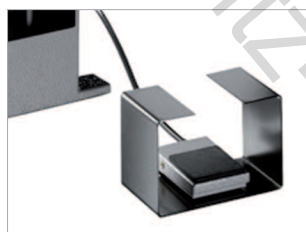
Agrafage électrique déclenché par pédale.