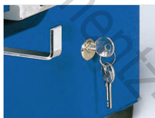
Possibilité de verrouillage à clé pour sécuriser l'utilisation (en option).