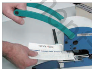
Grand levier pour une perforation sans effort jusqu'à 50 feuilles.