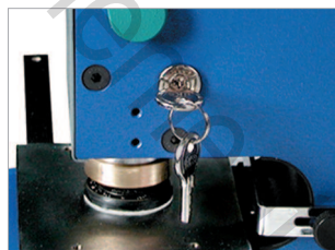
Possibilité de verrouillage à clé pour sécuriser l'utilisation (en option).