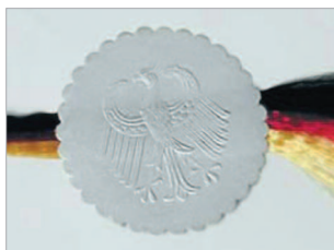
Marquage par timbre sec de 40 mm de diamètre.

Caractéristiques techniques non contractuelles. Modifiables sans préavis. Sauf erreurs typographiques.