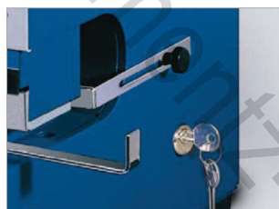
Possibilité de verrouillage à clé pour sécuriser l'utilisation (en option).