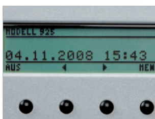
Panneau de commande LCD.

Garantie 1 an (6 mois sur les batteries).