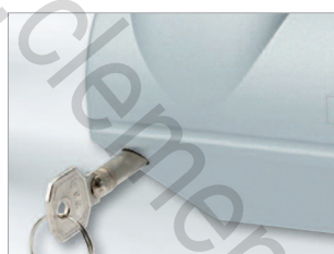
Serrure de boîtier (option).