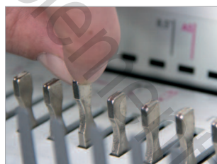
Poinçons débrayables individuellement (QSA).