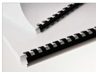
Releurs anneaux plastiques disponibles en plusieurs coloris.