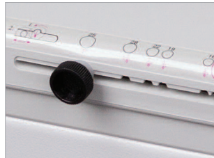
Curseur permettant d'ajuster l'ouverture des anneaux.