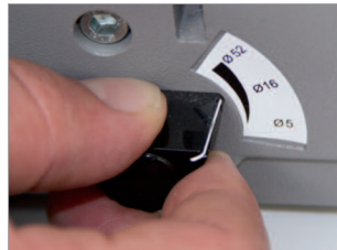
Marge de perforation réglable.