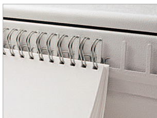
Peigne de positionnement de l'élément de reliure.