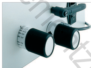
Molette pour ajuster le système de pression au diamètre de la reliure.