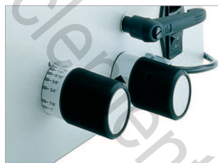
Molette pour ajuster le système de pression au diamètre de la reliure.