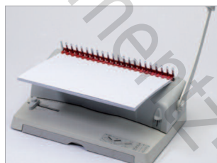
Un seul levier pour la perforation et l'ouverture des anneaux.