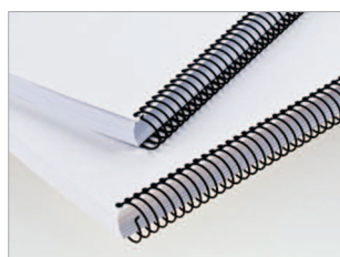
Reliure par spirales hélicoïdales métalliques ou plastiques.