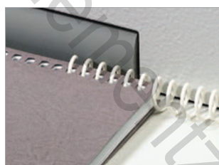
Insertion électrique de la spirale dans la liasse.