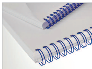
Reliures anneaux métalliques disponibles en plusieurs coloris.