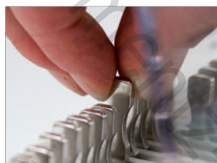
Poinçons débrayables individuellement (QSA).