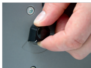
Marge de perforation réglable.