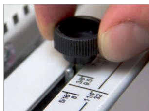
Curseur permettant l'ajustage du système de sertissage.