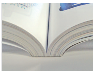
Un dos carré collé de haute qualité et très résistant.