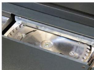
Fraisage des documents pour une meilleure pénétration de la colle.