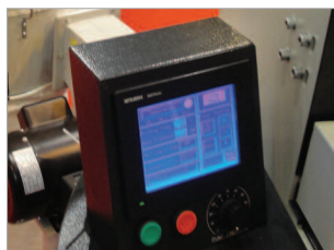
Grand écran de commande tactile très simple d'utilisation.