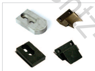
Exemples de couteau coin arrondi, couteau droit et matrices.