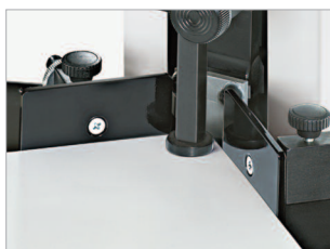
Butées de profondeur et latérales réglables en continu.