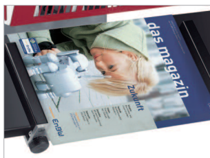
Plateau pivotant pour réaliser de l'agrafage à cheval (brochures).