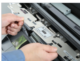
Changement du gabarit InstaSet facile et rapide.