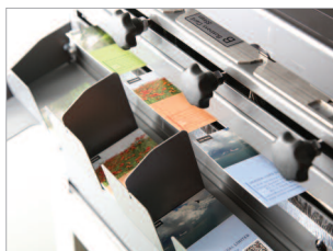
Plateau de réception pour cartes de visites, cartes postales, photos.