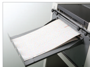
Plateau de réception adapté aux documents longs.