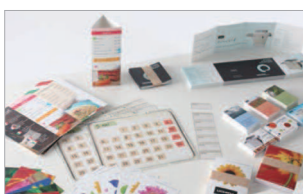
Réalisez des cartes de visite, cartes de vœux, photos, flyers, etc...