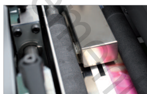
Lecteur de repère de coupe (adapté à l'impression numérique).