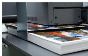
Prise papier à suction avec vitesse variable.