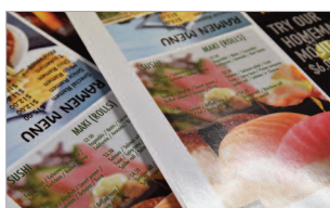
Pelliculage (lamination) pleine page, effet brillant ou mat.