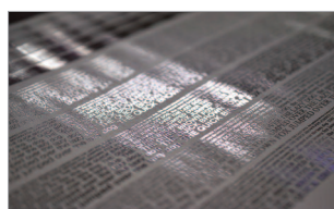
Dorure semi-sélective, or ou argent, effet métallique ou mat.