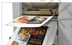
Impressionnante productivité jusqu'à 5 mètres par minute.