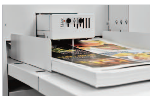
Système de prise papier à succion feuille à feuille.