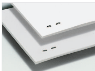
Possibilité de réaliser de l'agrafage standard ou de l'agrafage à plat.