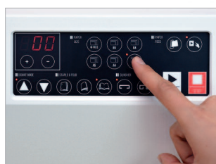
Panneau de commande très simple d'utilisation avec écran LED.