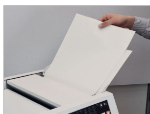
Agrafage-pliage automatique à l'insertion de la liasse.