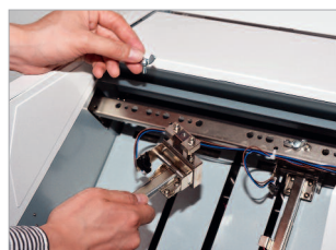
Deux têtes d'agrafage avec entraxe réglable (3 positions par tête).